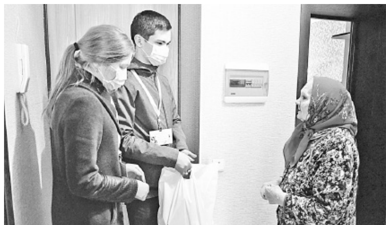
Волонтеры доставляют пенсионерам домой продукты, лекарства, корма для животных, оплачивают квитанции ЖКХ, помогают по хозяйству

Около 500 компаний из разных регионов России уже присоединились к акции #МыВместе. На сайте мывместе2020.рф они указали, какую конкретную поддержку готовы оказать. В частности, деньгами и медоборудованием выразили желание помочь порядка 300 организаций.