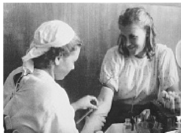
В экспозиции представлено множество уникальных фотографий

В музее истории г. Боровичи открылась масштабная выставка, посвящённая нашему городу в годы Великой Отечественной войны.